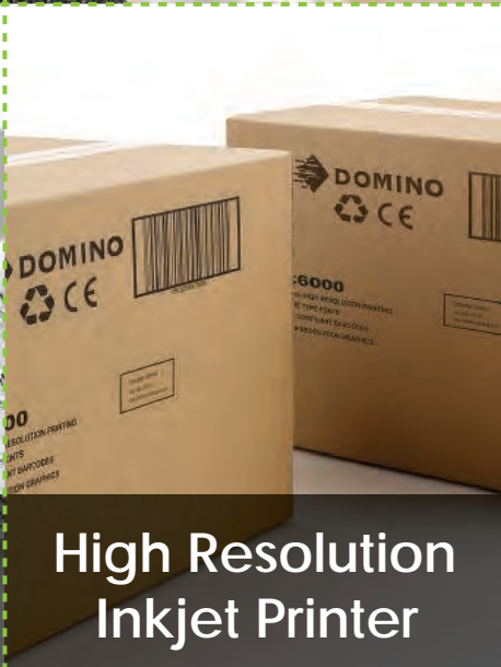
High Resolution Inkjet Printer