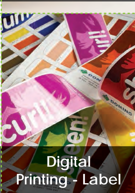
Digital Printing - Label