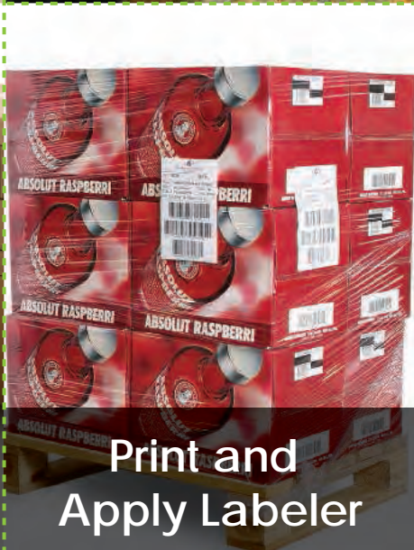
Print and Apply Labeler