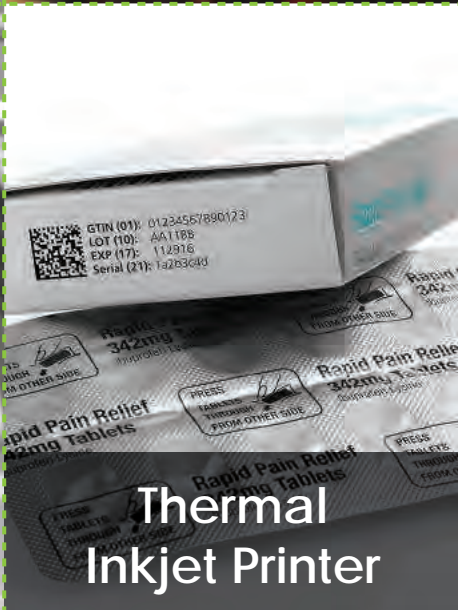
Thermal Inkjet Printer